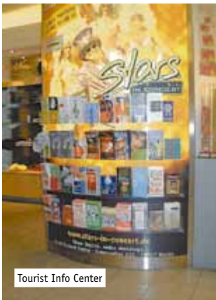
Tourist Info Center