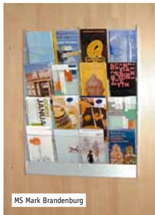
MS Mark Brandenburg