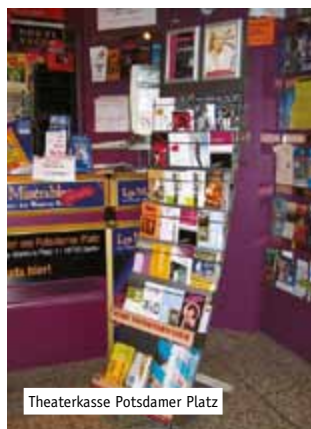
Theaterkasse Potsdamer Platz