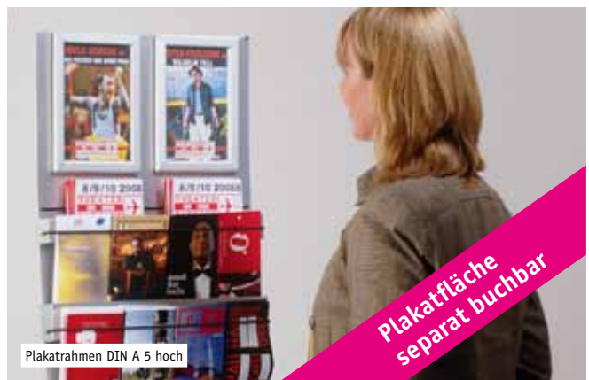
Plakatrahmen DIN A 5 hoch