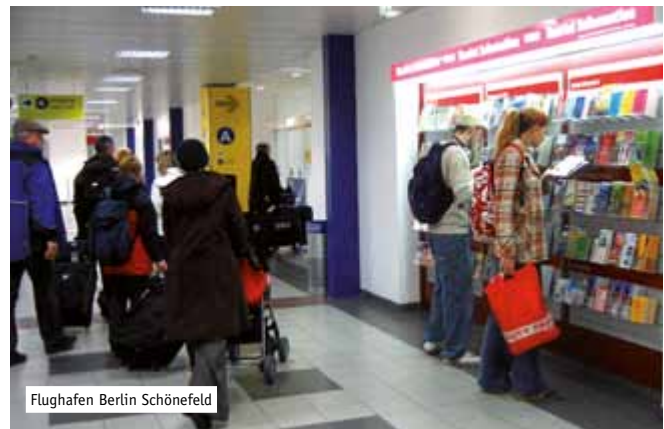
Flughafen Berlin Schönefeld