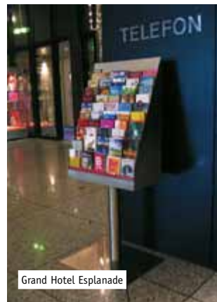
Grand Hotel Esplanade