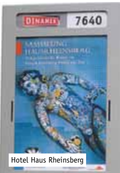
Hotel Haus Rheinsberg