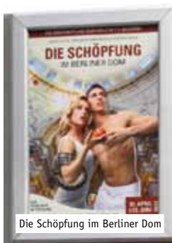
Die Schöpfung im Berliner Dom

AFÜNF Plakatflächen sind direkt in den DINAMIX CityCards- und Flyerdisplays integriert. Über 500 Locations bringen Ihre Kampagne in die Gastronomie. Als Solomedium oder in Kombination mit CityCards.