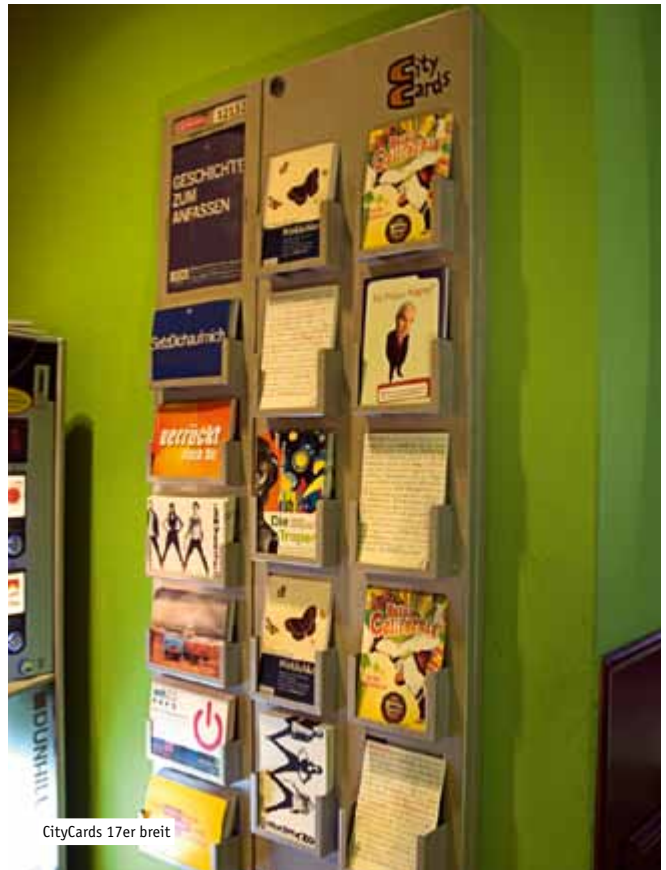
CityCards 17er breit