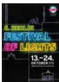
Festival of Lights