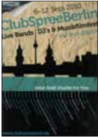
Berlin Music Week