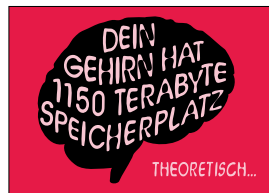
Lange Nacht der Wissenschaft