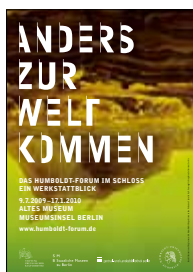
Staatliche Museen zu Berlin